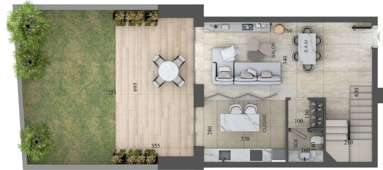
PLAN REZ DE CHAUSSEE