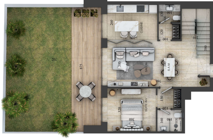
PLAN REZ DE CHAUSSEE